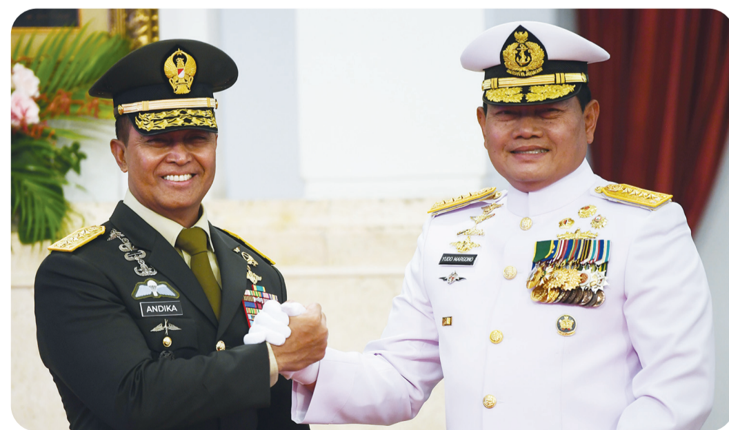
PELANTIKAN PANGLIMA TNI

Panglima TNI Jenderal TNI Andika Perkasa (kiri) berjabat tangan dengan calon Panglima TNI Laksamana TNI Yudo Margono (kanan) sebelum acara pelantikan di Istana Negara, Jakarta, Senin (19/12). Presiden Joko Widodo melantik Laksamana TNI Yudo Margono sebagai Panglima TNI menggantikan Jenderal TNI Andika Perkasa.